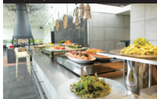
Onuma Tsuruga Auberge EPUI