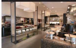
鶴雅 Tsuruga Buffet Dining SAPPORO