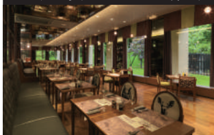
定山溪 鶴雅リゾートスパ 森の詞 Jozankei Tsuruga Resort Spa Mori no uta